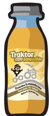
Saison-Smoothie: Apfel & Mandarine.

Werden im Winter überhaupt Fruchtsäfte getrunken? Eine Frage, die wir oft hören und bei der wir dann jeweils tief Luft holen und heftig mit dem Kopf nicken. Natürlich, und wie! Gerade in den kalten Tagen braucht man viel Energie und darum ist ein Vitaminschub nie verkehrt. Ausserdem kann man sich nicht 4 Monate lang nur von heissen Marronis ernähren. Der Traktor schafft Abwechslung: Apfel & Mandarine heisst der neue Wintersmoothie, der von Anfang Dezember bis zirka Ende März auf unserem Anhänger sein wird. Eine Prise Lebkuchengewürze gibt dem Ganzen noch den nötigen winterlichen Schwung.