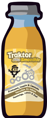
Zwetschge, Cassis & Zimt